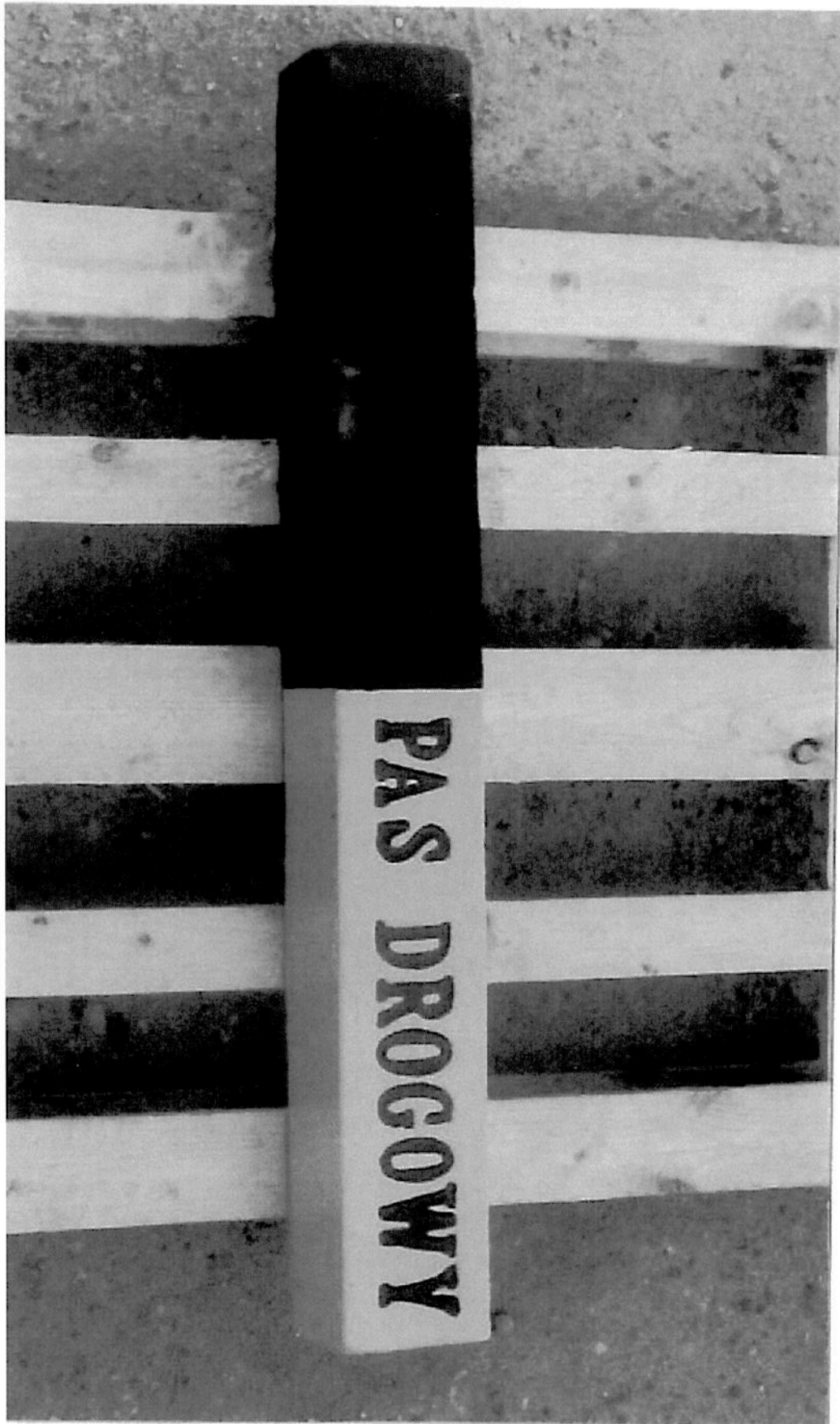
Załącznik nr 2 - Przykładowe zdjęcie - Świadek graniczny pasa drogowego