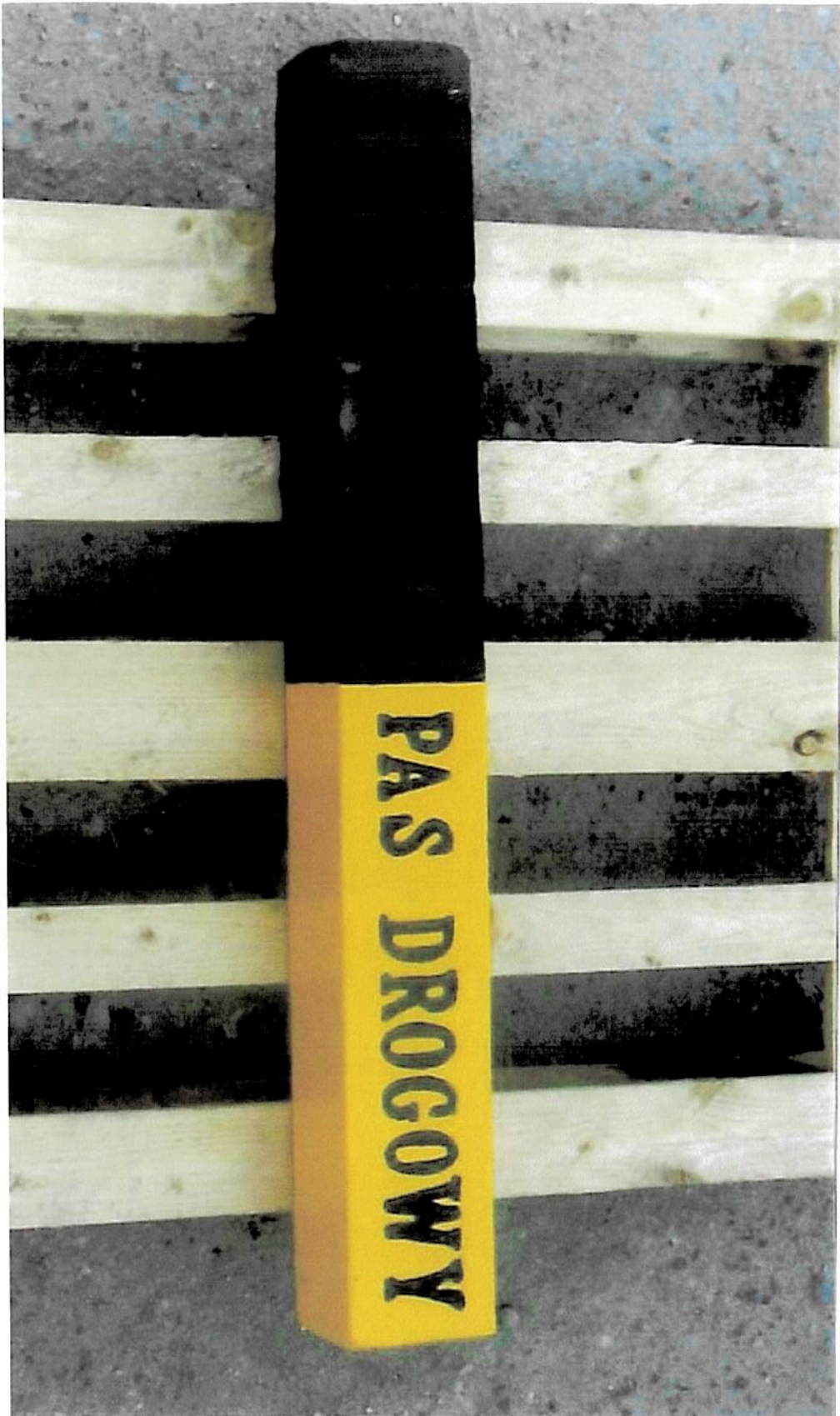
Załącznik nr 2 - Przykładowe zdjęcie - Świadek graniczny pasa drogowego