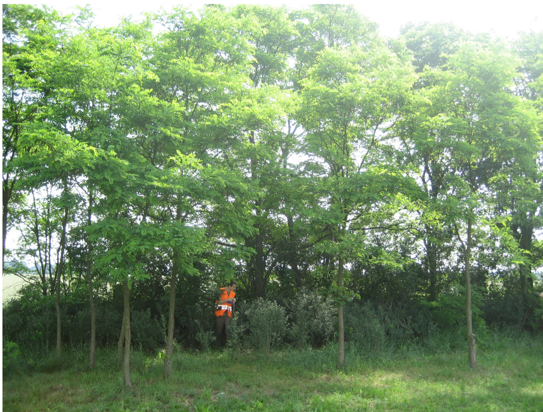
Fot. 16. Drzewa od nr 145-153