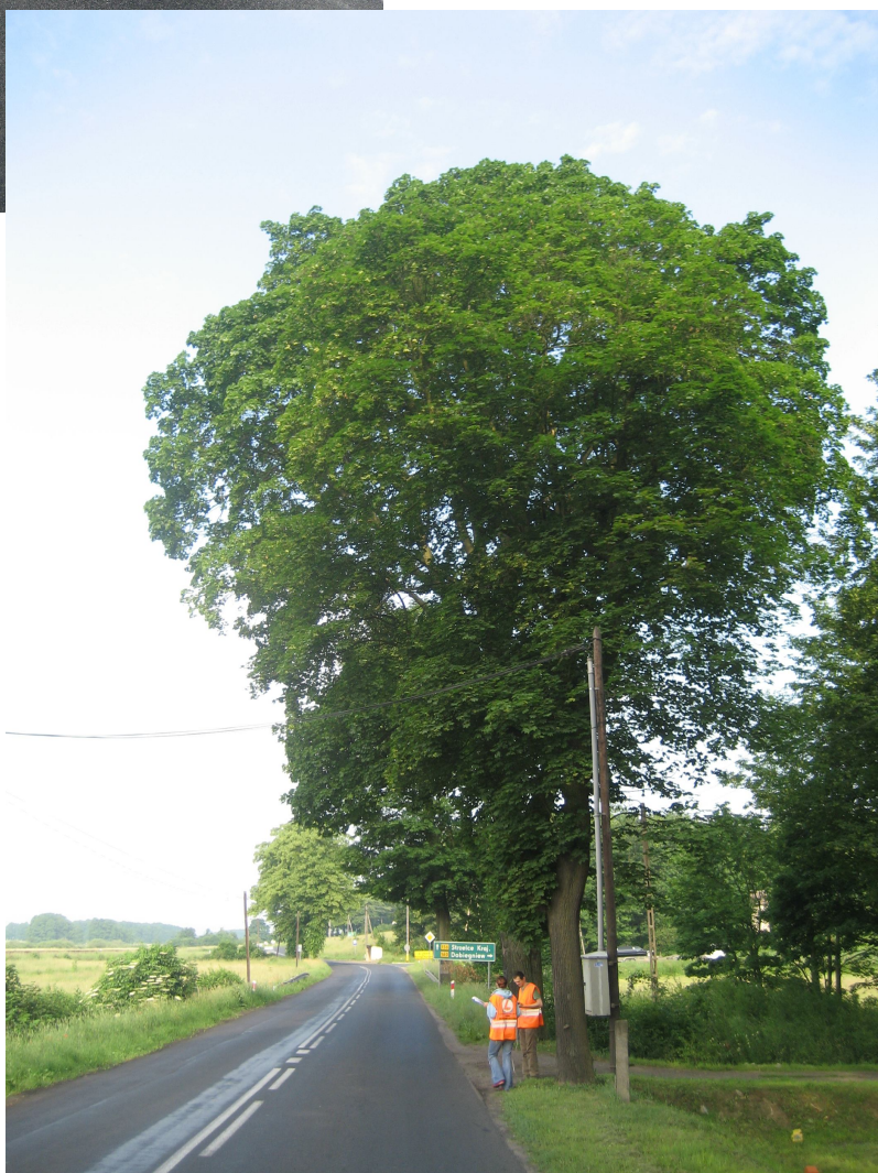
Fot. 4. Z prawej drzewo nr 82, 81