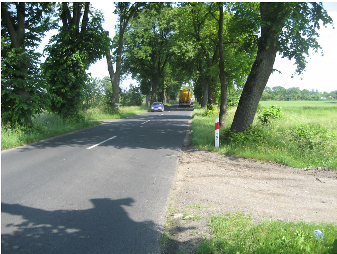
Fot. 15. Zadrzewienie wzdłuż drogi wojewódzkiej nr 160, w granicach przyszłej inwestycji