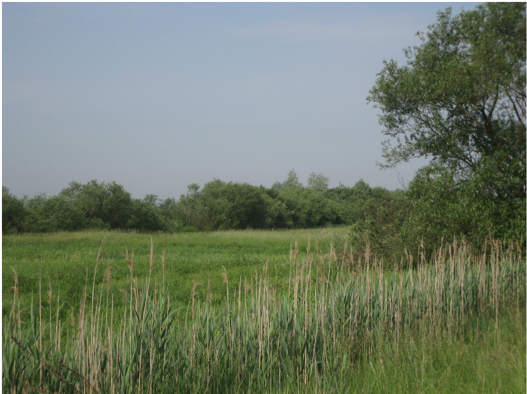
Fot. 10. Krzewy w km 0+250