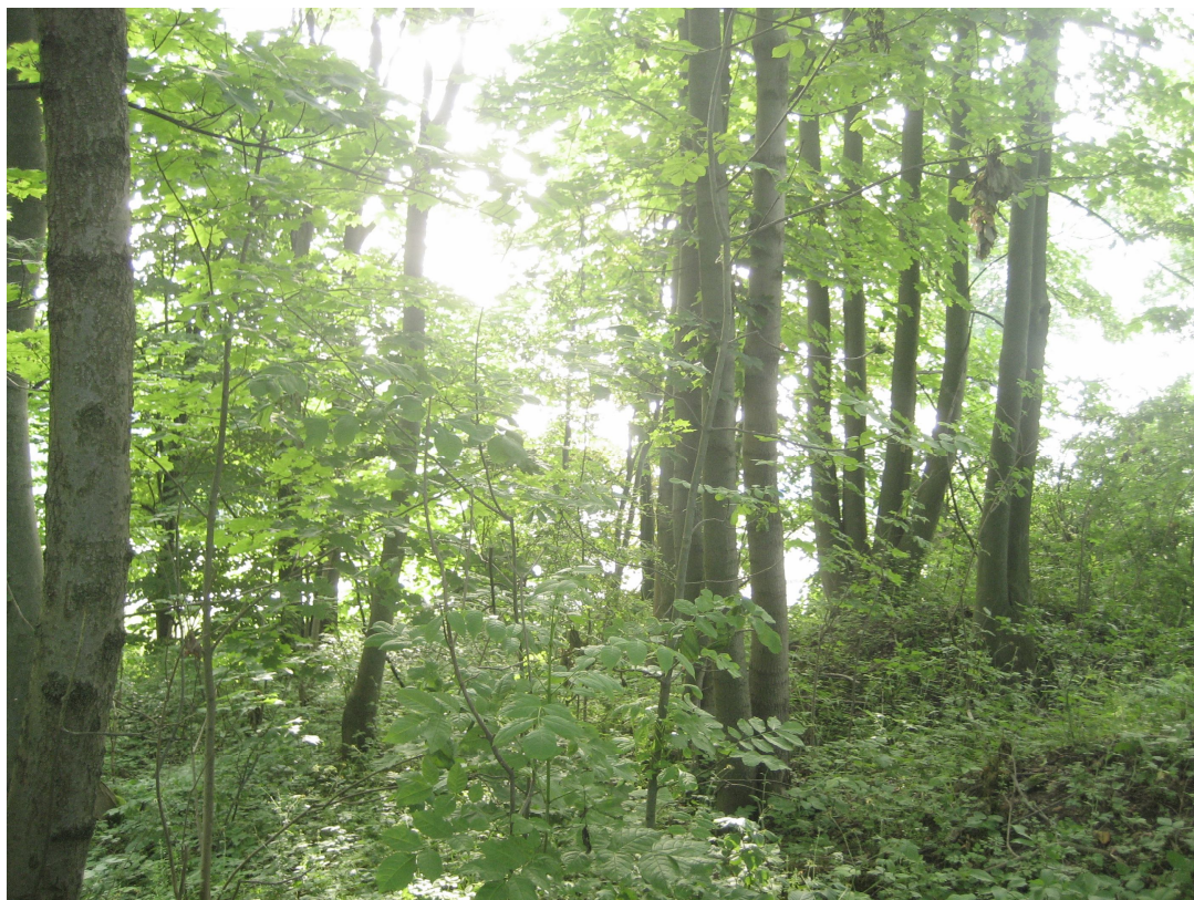
Fot. 8. Skupisko drzew przy rondzie w km 0+000,00 – drzewa o numerach 5-79