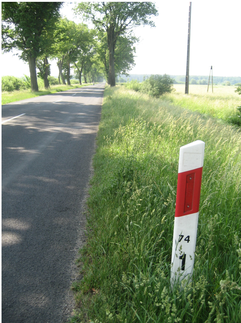
Fot. 12. Zadrzewienie wzdłuż drogi wojewódzkiej nr 160, w granicach przyszłej inwestycji