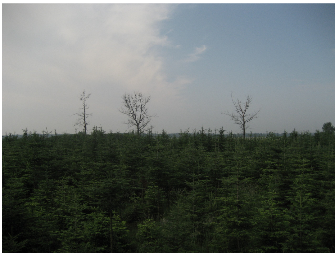
Fot. 9. Młodnik sosnowy w km 0+080 – 0+150 i od lewej drzewa nr 86 i 85