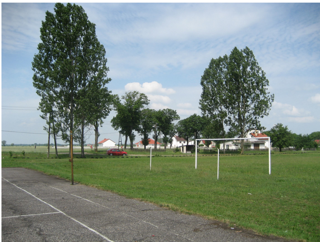
Fot. 17. Od strony prawej drzewa 190 i 189