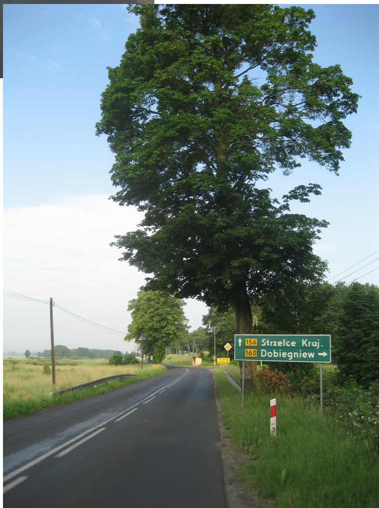
Fot. 2. Z prawej drzewo nr 80