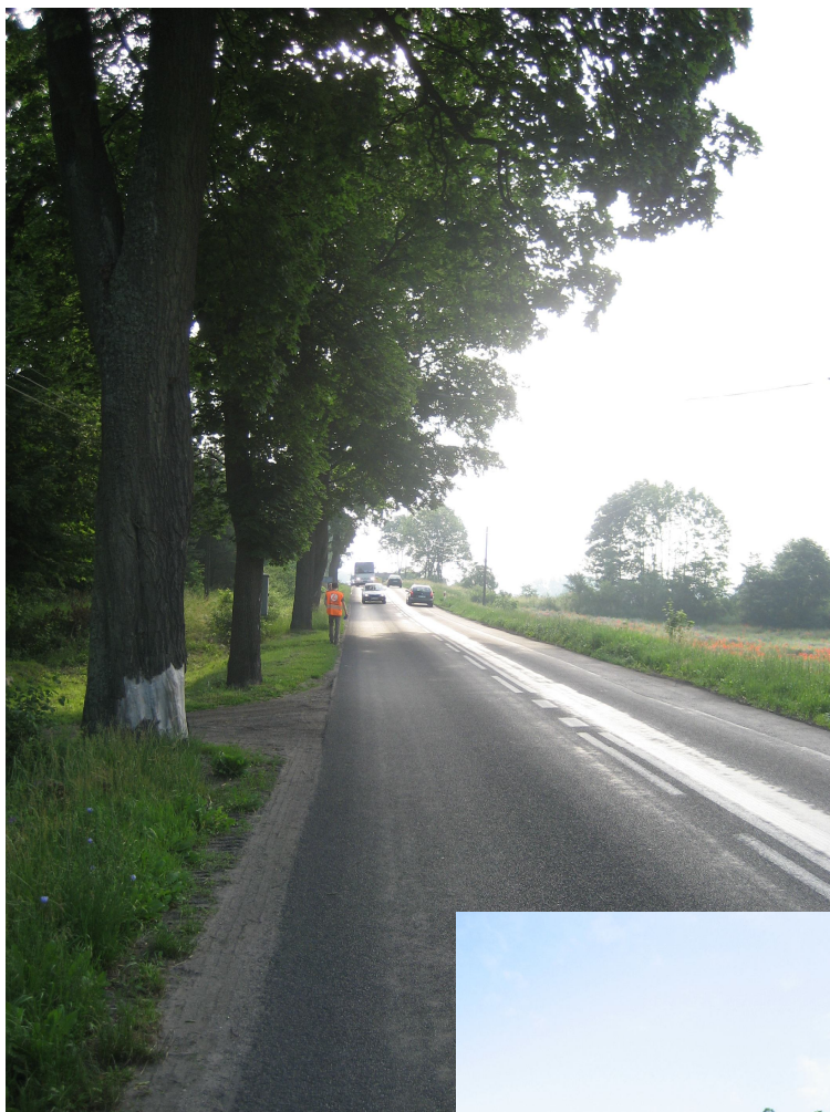
Fot. 3. Z lewej drzewo nr 81, 82, 83, 84