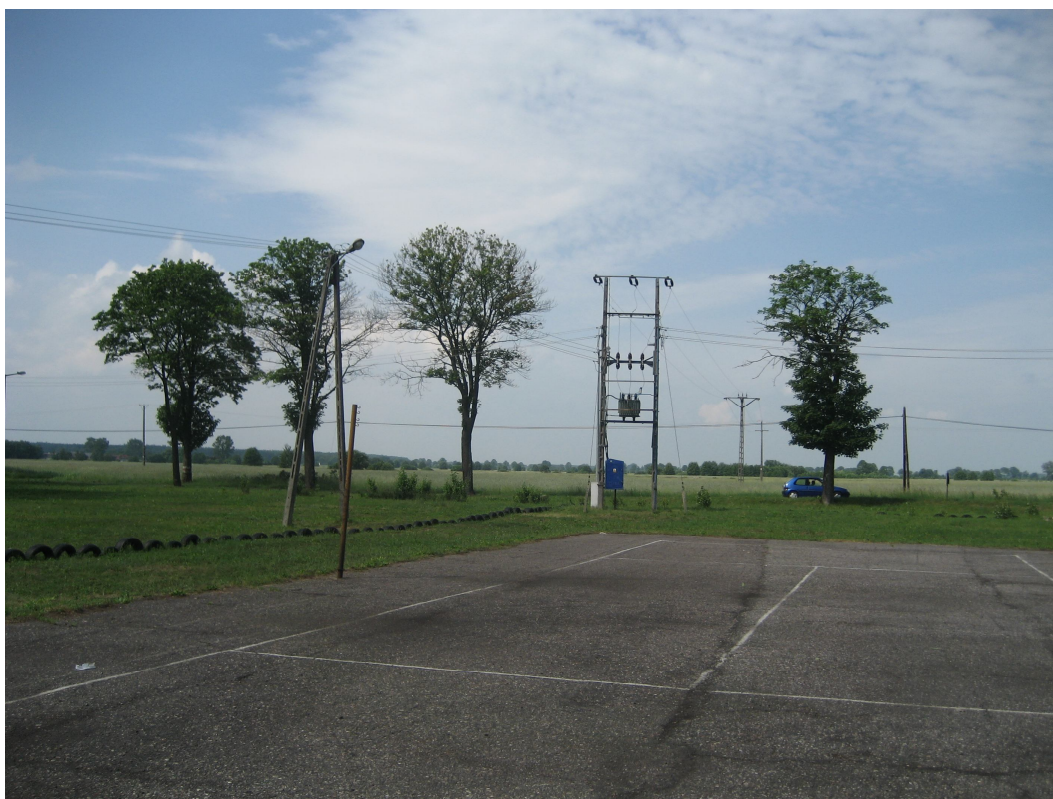
Fot. 18. Od strony lewej drzewa nr 174, 175, 176, 177