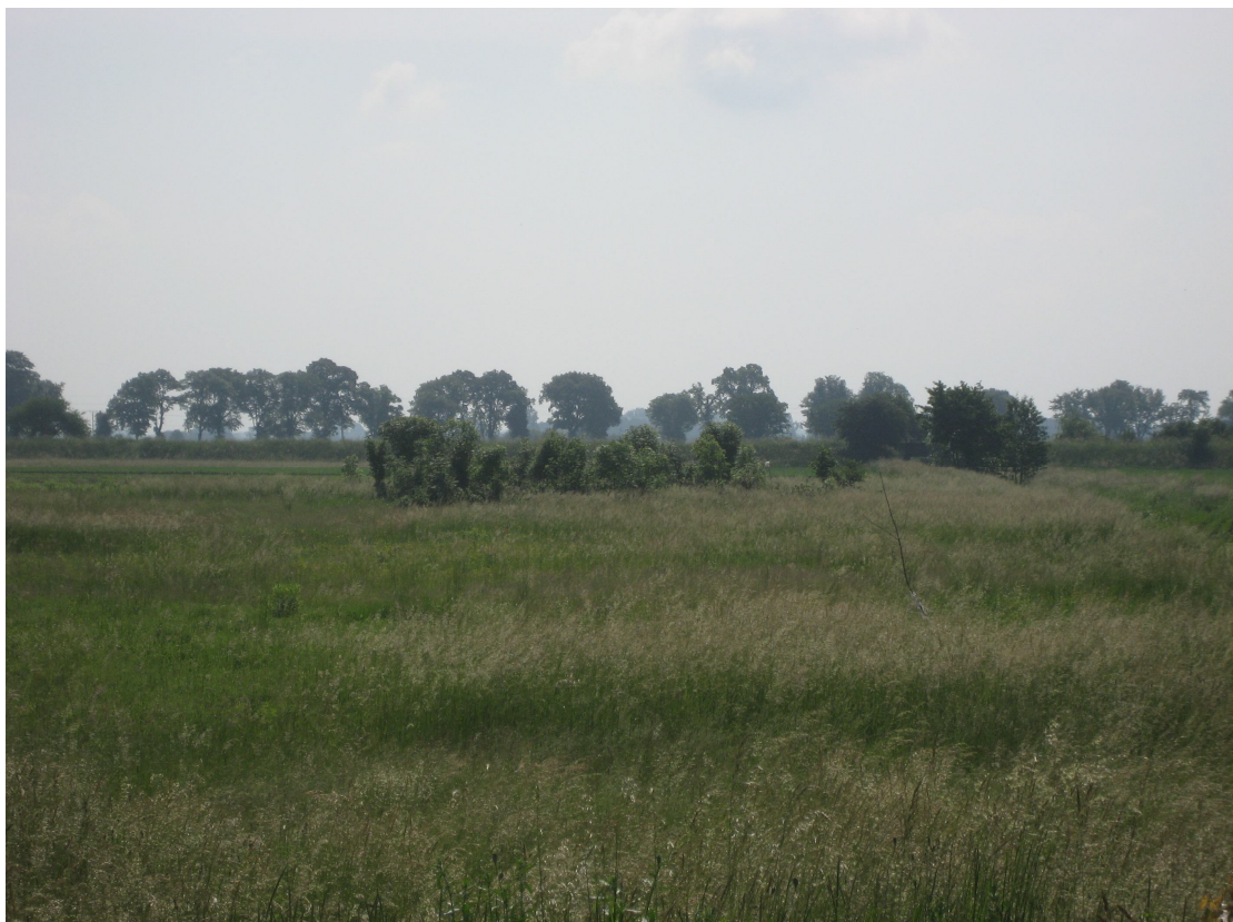
Fot. 11. Krzewy w km 0+250