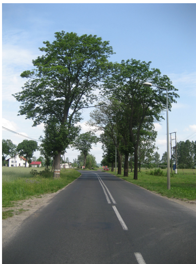
Fot. 19. Od strony prawej drzewa 174, 175, 176, 177, po stronie lewej drzewo nr 173