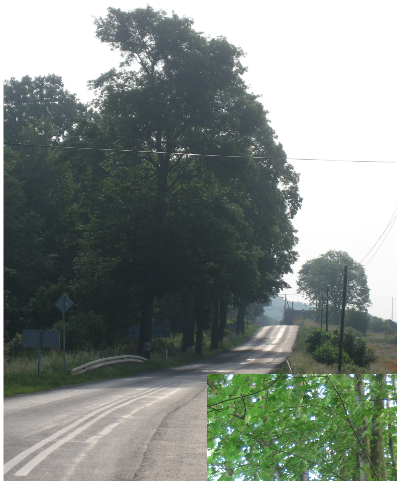
Fot. 6. Skupisko drzew przy rondzie w km 0+000,00 – drzewa o numerach 5-79