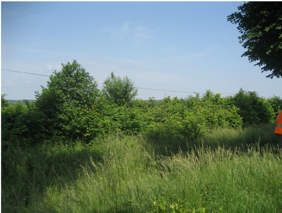
Fot. 14. Zakrzewienia wzdłuż drogi wojewódzkiej nr 160, w granicach przyszłej inwestycji