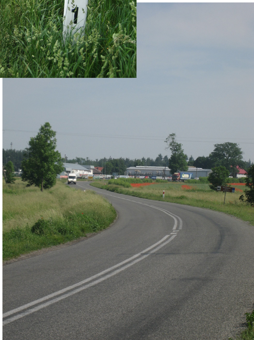
Fot. 13. Widok na drzewa nr 87 i 88