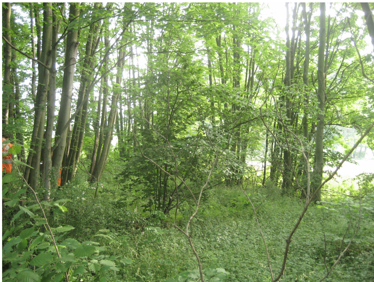
Fot. 7. Skupisko drzew przy rondzie w km 0+000,00 – drzewa o numerach 5-79