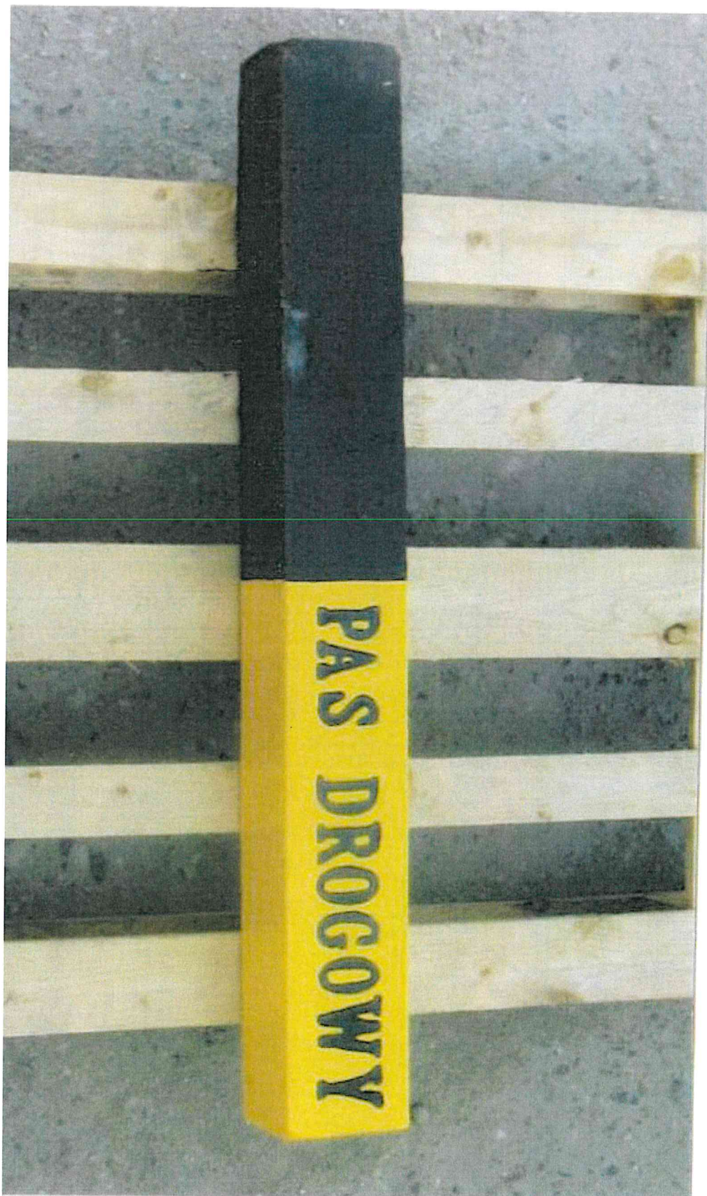
Zał. nr 2 - Przykładowe zdjęcie - Świadek graniczny pasa drogowego