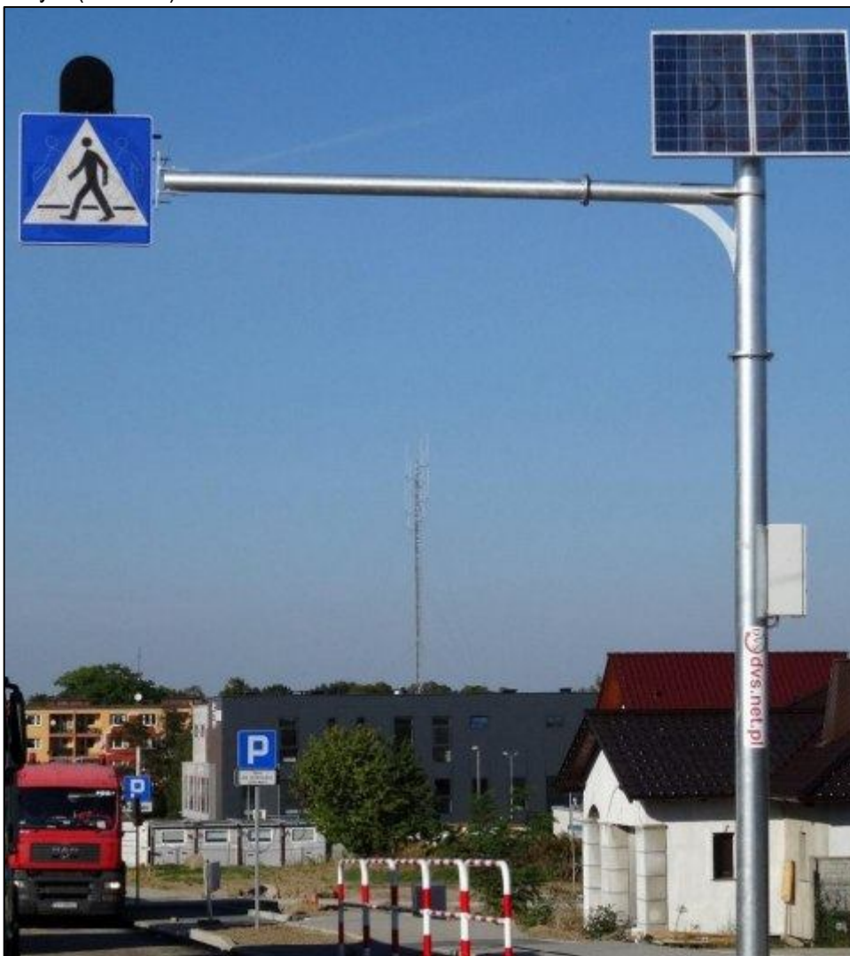
Zdjęcie nr 6 - zdjęcie poglądowe znaku aktywnego D-6 wraz z zasilaniem energią słoneczną na słupie wysięgnikowym (maszcie).