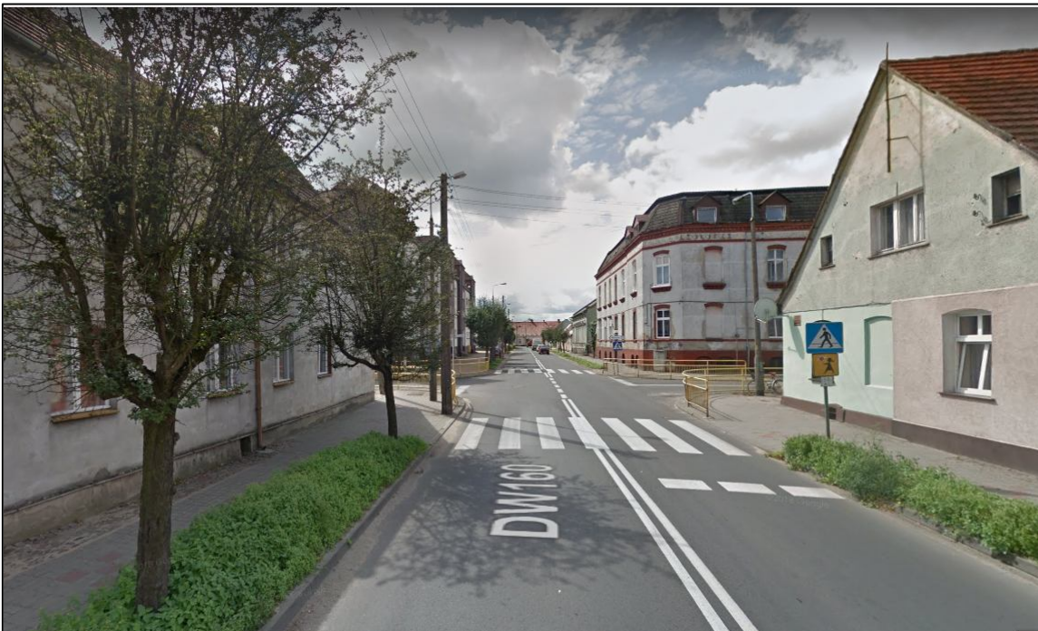
Zdjęcie nr 4 - lokalizacja ustawienia znaku aktywnego D-6 wraz z zasilaniem energią słoneczną na słupie wysięgnikowym (maszcie).