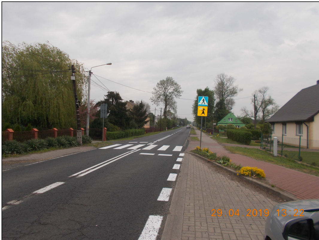
Zdjęcie nr 7 - lokalizacja ustawienia znaku aktywnego D-6 wraz z zasilaniem energią słoneczną na słupie wsporczym.