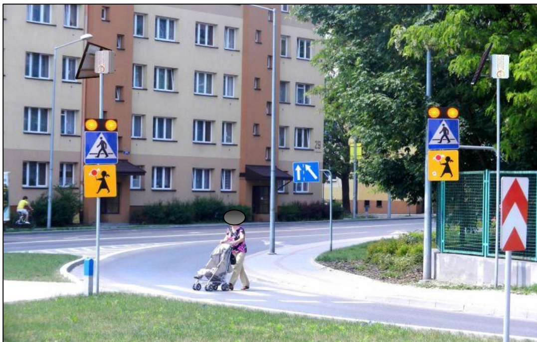
Zdjęcie nr 8 - zdjęcie poglądowe znaku aktywnego D-6 wraz z zasilaniem energią słoneczną na słupie wsporczym.