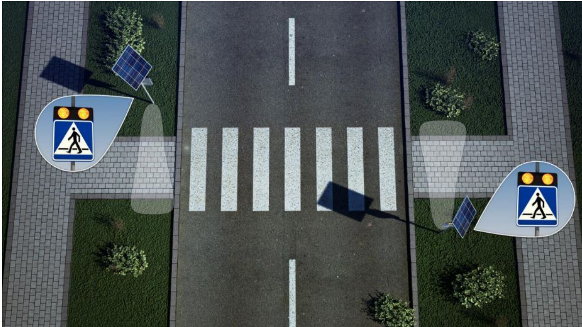
Zdjęcie nr 9 - zdjęcie poglądowe znaku aktywnego D-6 wraz z zasilaniem energią słoneczną na słupie wsporczym.