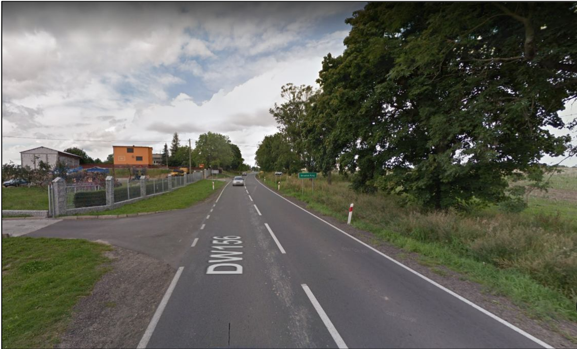
Zdjęcie nr 1 - lokalizacja ustawienia radarowego wyświetlacza prędkości wraz z zasilaniem energią słoneczną na słupie wsporczym.