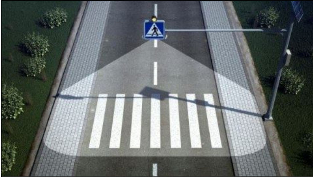
Zdjęcie nr 5 - zdjęcie poglądowe znaku aktywnego D-6 wraz z zasilaniem energią słoneczną na słupie wysięgnikowym (maszcie).