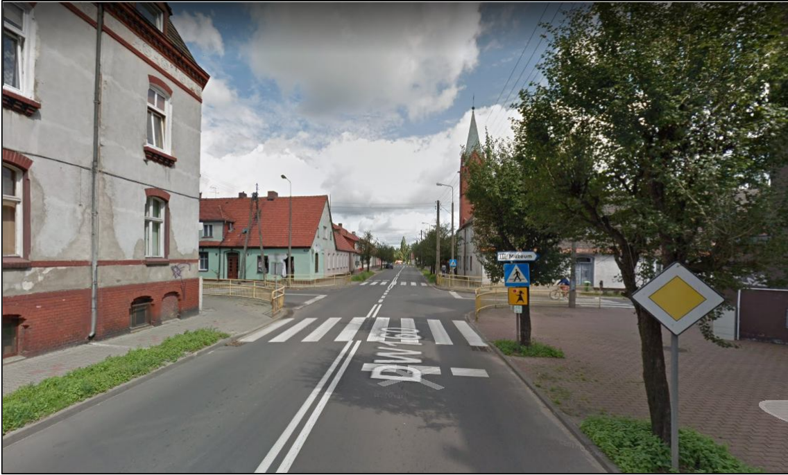
Zdjęcie nr 3 - lokalizacja ustawienia znaku aktywnego D-6 wraz z zasilaniem energią słoneczną na słupie wysięgnikowym (maszcie).