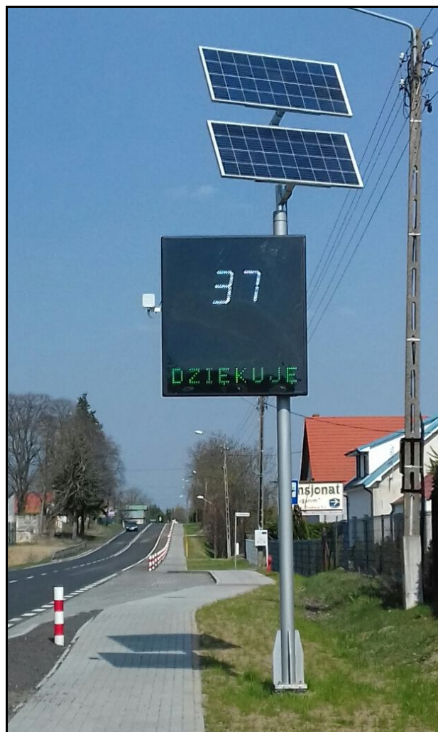
Zdjęcie nr 2 - zdjęcie poglądowe radarowego wyświetlacza prędkości wraz z zasilaniem energią słoneczną na słupie wsporczym.