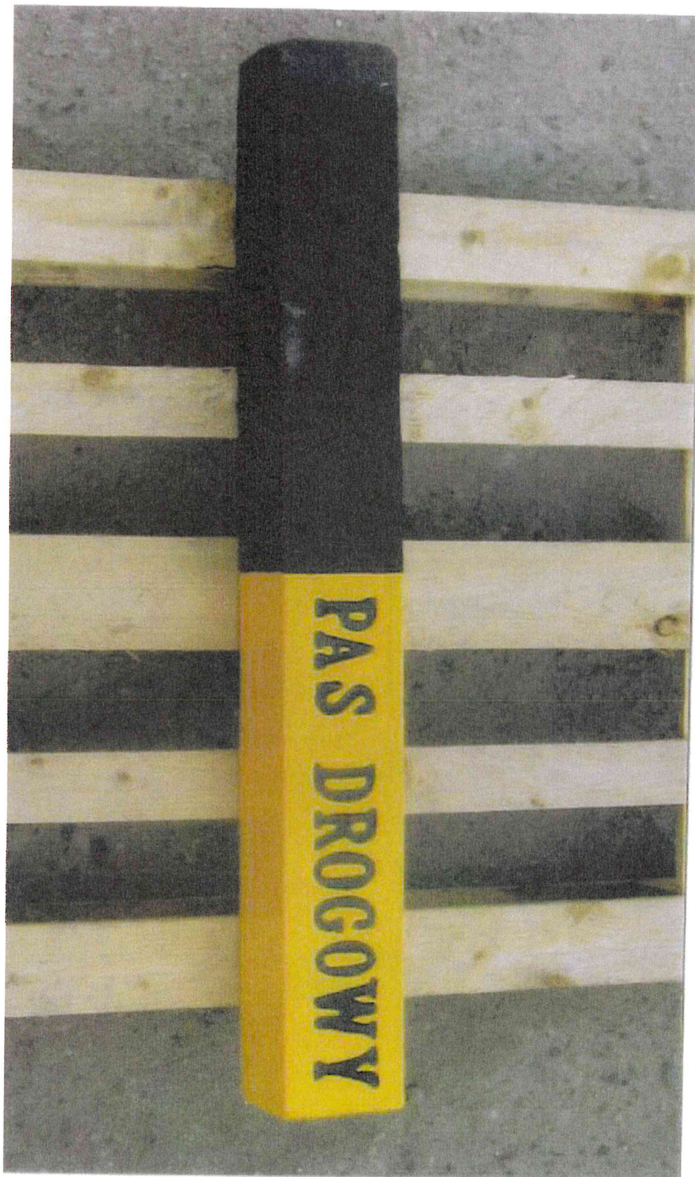
Załącznik nr 2 - Przykładowe zdjęcie - Świadek graniczny pasa drogowego