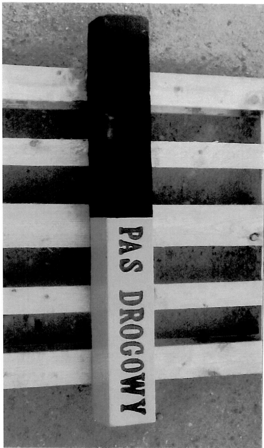
Zał. nr 2 - Przykładowe zdjęcie - Świadek graniczny pasa drogowego