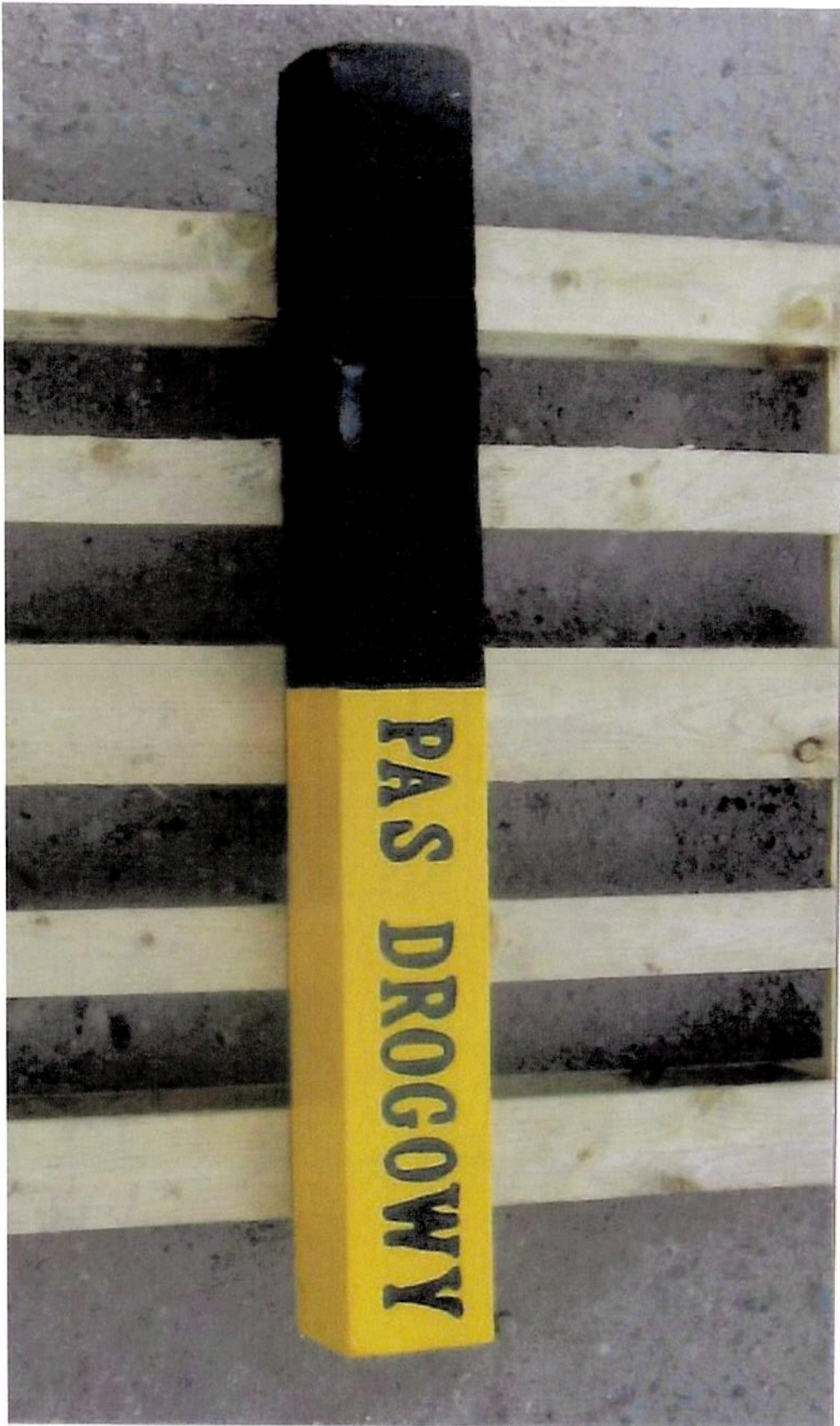
Załącznik nr 2 - Przykładowe zdjęcie - Świadek graniczny pasa drogowego