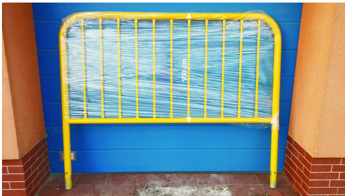
Rys. nr 4. Przykład poręczy zabezpieczającej z rur stalowych \varnothing 60mm z pionowymi słupkami \varnothing 20mm malowane proszkowo na kolor żółty. dł. 2m, wys. 110cm