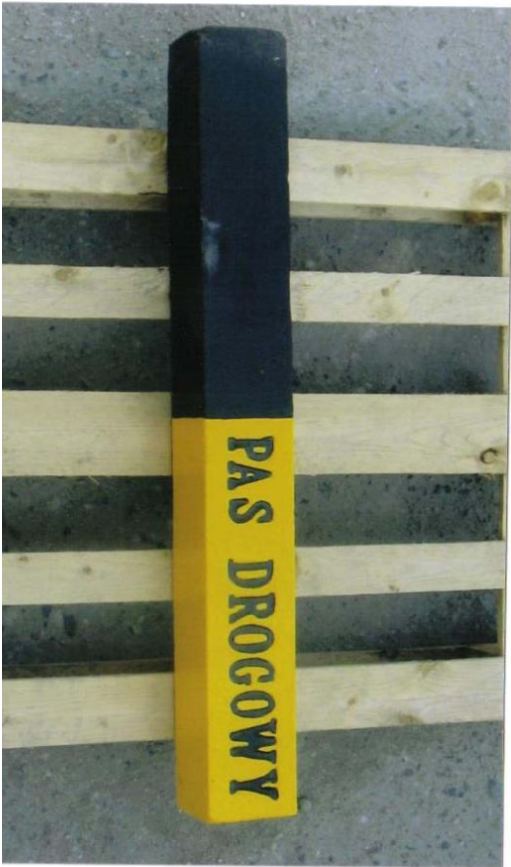
Załącznik nr 2 - Przykładowe zdjęcie - Świadek graniczny pasa drogowego