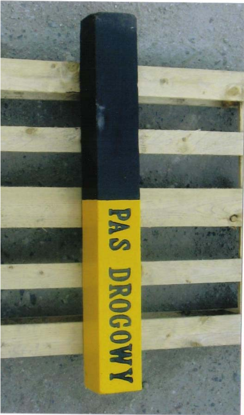
Zał. nr 2 - Przykładowe zdjęcie - Świadek graniczny pasa drogowego