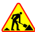
Znak A4 roboty drogowe