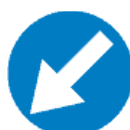
C-10 nakaz jazdy z lewej strony znaku